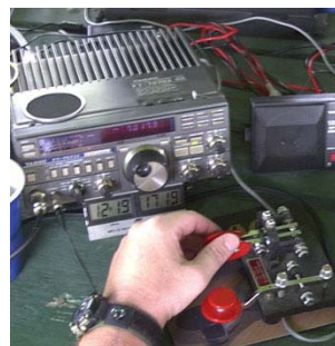
Il famoso Paddle Brown Brothes

Mentre stavo bello comodo a casa a preparare questo articolo col computer, non avevo la più pallida idea di quale fosse il vostro livello di preparazione e quindi ho deciso di prenderla alla larga partendo dagli elementi fondamentali; va bene?