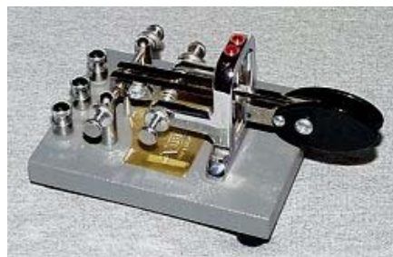
Paddle IAMBIC o squeeze

E veniamo adesso al paddle IAMBIC a leva doppia, i più sofisticati manipolatori. Altrimenti detto manipolatore «squeeze» per via del (tipico) movimento fisico delle dita, che è simile allo “spremere” insieme le palette per trasmettere un qualsiasi carattere (o numero). Non c'è differenza fra modo A e modo B.