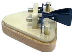
Paddle Brass Racer iambic, leggete l'ultimo numero di QST