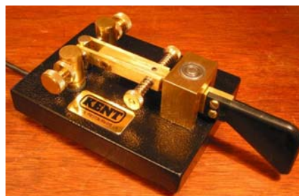
Il paddle a leva singola

Arriviamo poi al primo keyer elettronico. Storicamente, qualcuno che aveva tempo ed energie da spendere s'è messo a fare degli studi per realizzarlo. Il mio primo keyer è stato un Hallycrafters TO, parecchio tempo addietro (parlo per voi giovani roditori nel pubblico). Non aveva nessun tipo di memorie quel keyer, soltanto due valvole nude e crude, ma che temporizzavano punti e linee che era uno splendore. Facciamo adesso lo stesso giochetto del conteggio delle battute, però stavolta col keyer elettronico useremo un paddle a leva singola. Alcuni dei migliori operatori CW che conosco, utilizzano ancora il paddle a leva singola. È ciò che più assomiglia al bug, operativamente parlando, ed è anche il più semplice modo di transizione verso la “nuova tecnologia”, oltretutto col vantaggio della rapidità di apprendimento del suo uso.