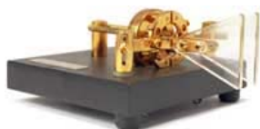
Paddle Bencher, leggete l'ultimo numero di QST