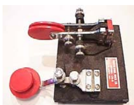
Paddle Brown Brothers, ormai fuori produzione

E allora cominciamo, ecco la roba che serve: un paddle IAMBIC, un keyer, dei cavi di collegamento e un elenco telefonico. Ecco delle foto di alcuni di questi articoli per prendere familiarità di come sono fatti, oppure per sbalordire i vostri amici, quando capita di trovarli su di un tavolo alle mostre di scambio, indicando che tipo è quello e come lo si usa, e cosa c'è da sapere su come va regolato. Cercate di essere il primo della vostra classe nel prenderlo e nell'usarlo.