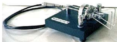
Paddle Bencher con base nera, ricondizionati da K5FO leggete l'ultimo numero di QST